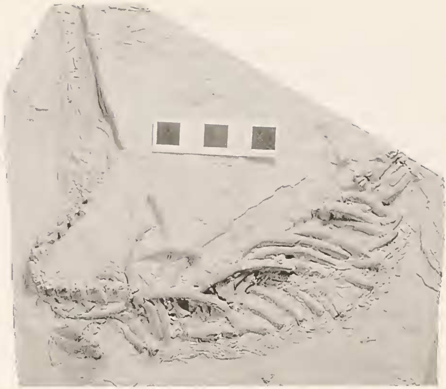
Abb. 1: Mesosaurus tenuidens . Positivabguß eines Typus-Exemplares von M. "brasiliensis" (McGREGOR, 1908) aus dem American Museum of Natural History. Original ist Hohlform eines Ölschieferstücks. Maßstab = 50 mm.